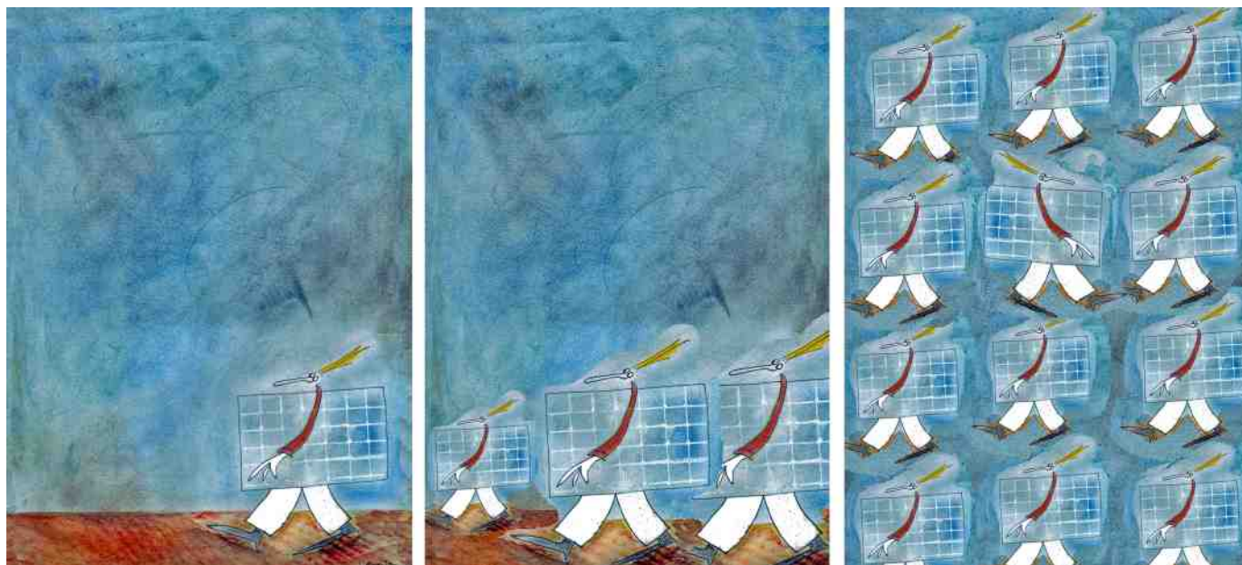
Énergie renouvelable / panneaux photovoltaïques

Les Bonhommes invités aux Conf'errances spontanées s'accordent avec facilité à cette aventure.