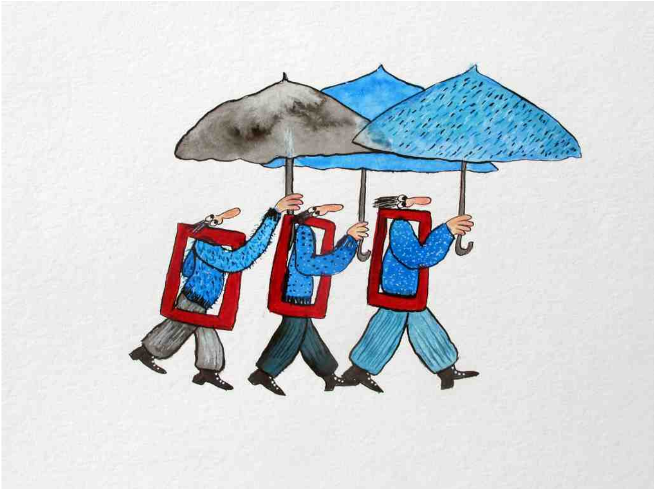
Résidence de création juin 2021 - La Maison de l'environnement du Malsaucy - Département du Territoire de Belfort