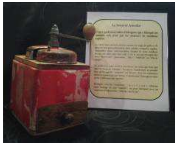
Le broyeur à mots durs

Avec son atelier de réparation de machines à mots.