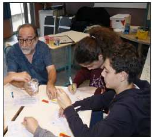
Les intervenants ont donné le désir aux jeunes de lire et d'écrire.

Les intervenants ont donné aux jeunes le désir de lire et d'écrire, d'inviter chacun à devenir disséqueurs de sèmes, chercheurs de rimes... Bref, ils sont parvenus à les rendre amoureux des mots.