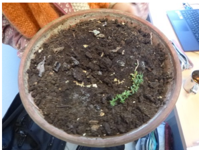
Fig. 7-9 :