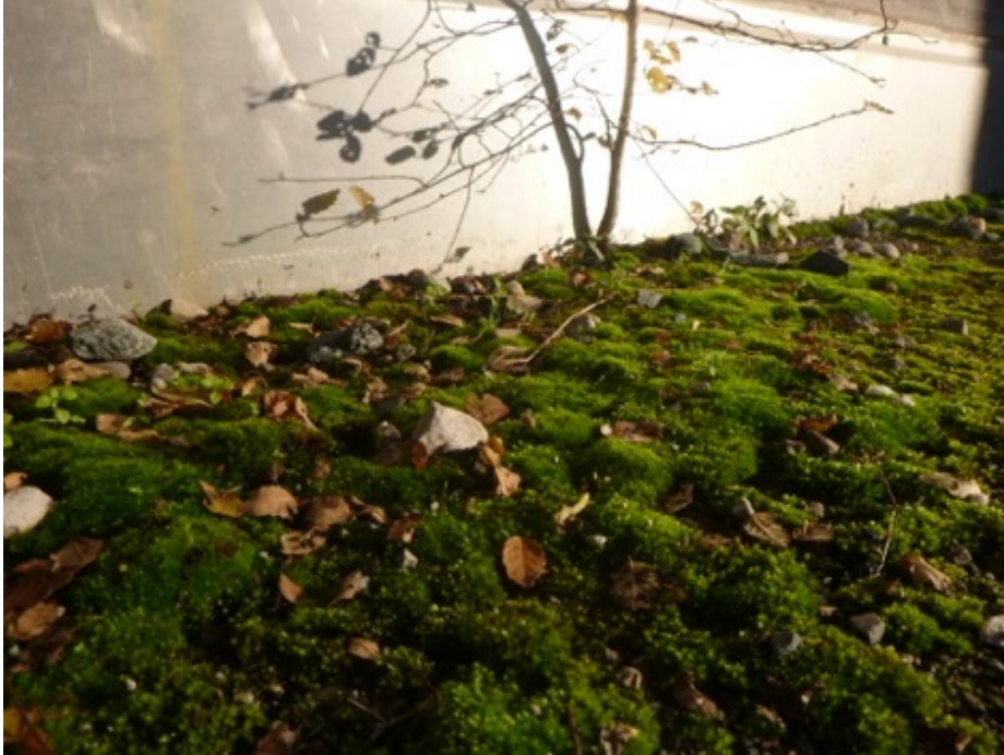
Fig. 17 : Nano-forêt et micro-écosystème.

Finissons alors cette exploration avec une courte contemplation.