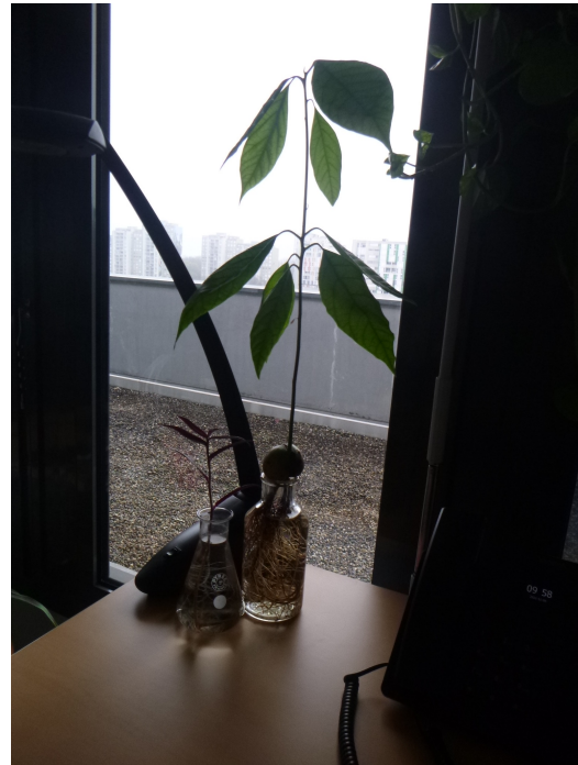
Fig. 4 – 6 :

Système racinaire dans le bureau de Pauline.