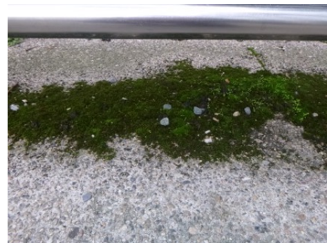
Fig. 14 à 16 :