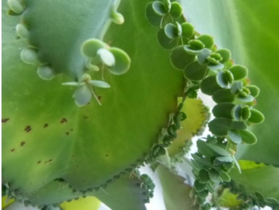
Fig. 12 : Des clones à l'IUGA.

Malgré le calme apparent, une Bryophyllum daigremontianum met au monde d'autres Bryophyllum daigremontianum et ce en grand nombre. Des Bryophyllum daigremontianum toutes identiques à la Bryophyllum daigremontianum mère. Comme d'un mouvement de danse lent et imperceptible, la plante mère pousse au monde des petits clones naturels destinés à se faire enlever par les employés du site pour être amenés dans les bureaux y être choyés et arrosés pour que le cycle reprenne.