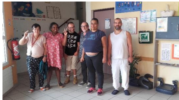
Retrouvailles à la Villa Arpin fin septembre